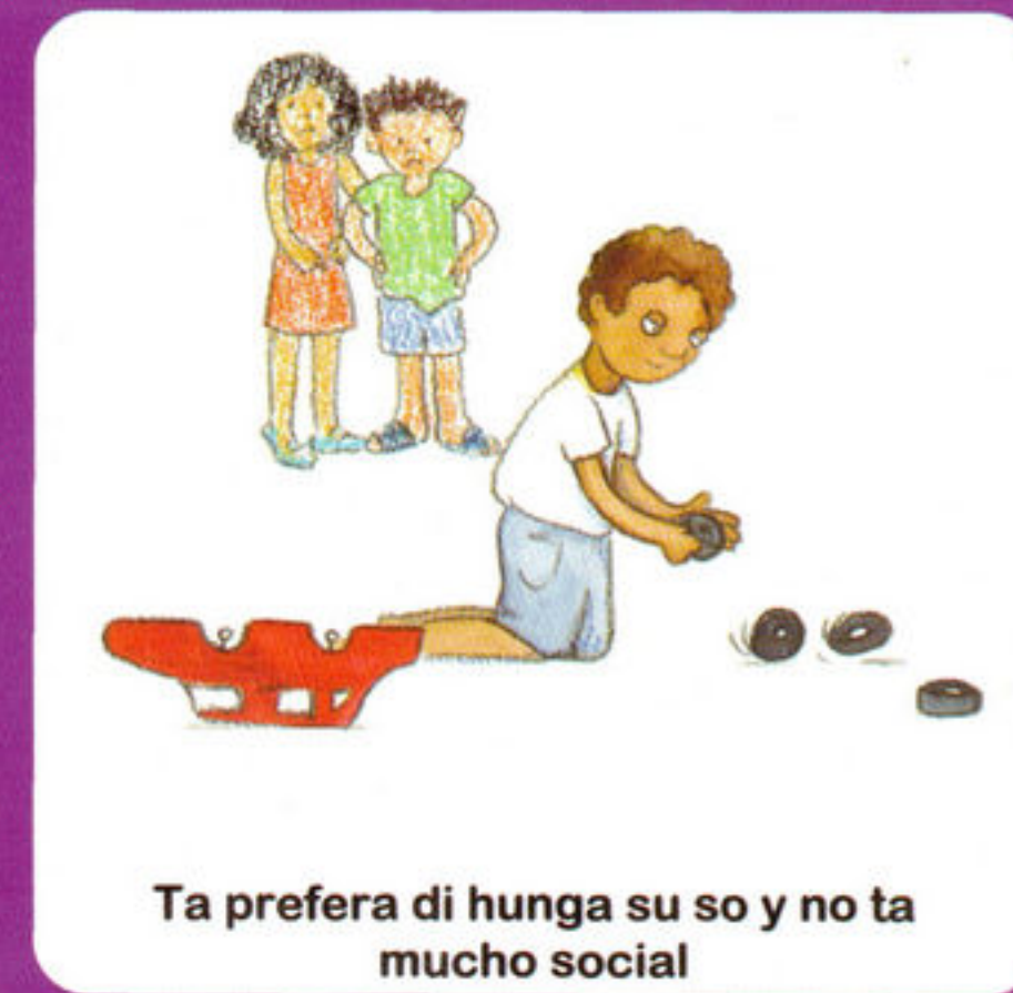
Ta prefera di hunga su so y no ta mucho social